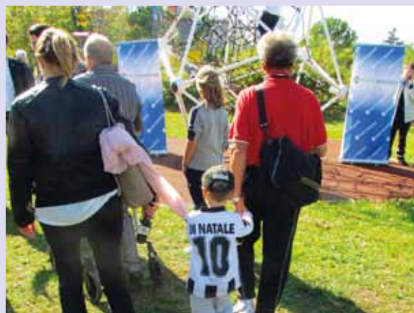
Alcuni momenti dell' inaugurazione del 13 ottobre 2011